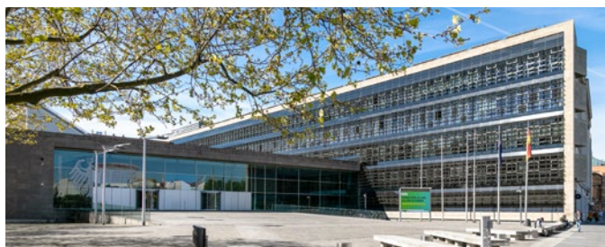
Das Bundespresseamt in Berlin

Kernauftrag des Presse- und Informationsamts der Bundesregierung – kurz Bundespresseamt (BPA) – ist es, die Öffentlichkeit und die Medien transparent, verständlich und verlässlich über die Regierungspolitik zu informieren. Unser demokratisches Gemeinwesen braucht informierte Bürgerinnen und Bürger. Nur wenn möglichst viele Menschen, auch Sie persönlich, über Politik informiert sind, sich eine fundierte Meinung bilden können und am öffentlichen Gespräch beteiligen, bleibt unser demokratisches Gemeinwesen lebendig. Dazu trägt eine freie und vielfältige, auch digitale Medienlandschaft bei. Sie ermöglicht eine breite, wo nötig kontroverse Debatte über Probleme und Lösungen.