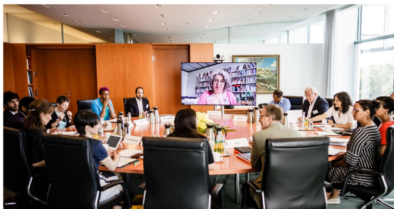
Staatsministerin Reem Alabali-Radovan und der Expert*innenrat